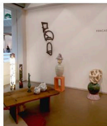
Vue du stand de la galerie bruxelloise Fracas avec les céramiques de l'artiste allemande Sarah Pschorn.